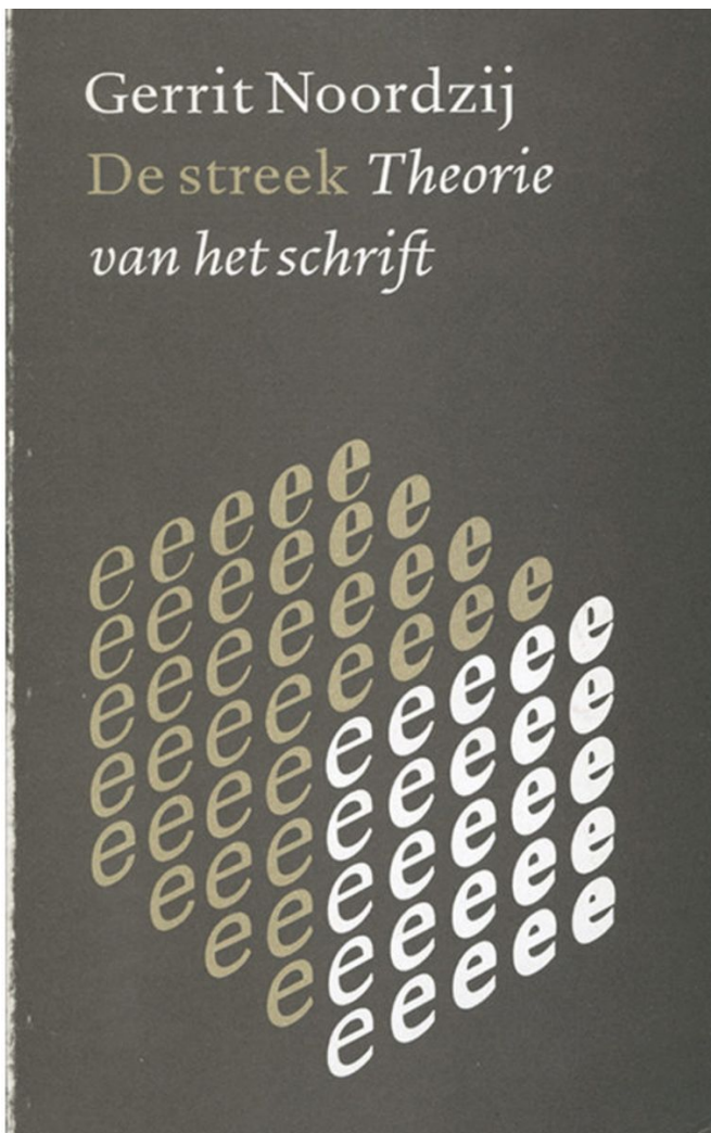
Omslag van 'De streek, theorie van het schrift' van Gerrit Noordzij.

De op 17 maart op 90-jarige leeftijd overleden Gerrit Noordzij was ontwerper van klassieke boekomslagen, postzegels en de jubileumrijksdaalder voor 400 jaar Staat der Nederlanden. Zijn omslagen voor uitgeverij Van Oorschot, en dan vooral die voor de langlopende Russische bibliotheek, zijn klassiek, simpel en ze hebben een krachtige identiteit.